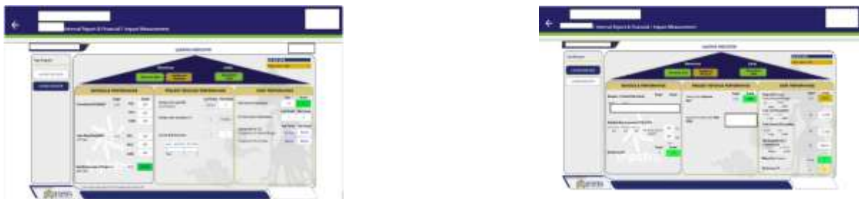
Gambar 3. Dashboard Leading dan Lagging Indicator

Salah satu fitur utama dalam LPMS adalah dashboard indikator leading dan lagging, yang digunakan untuk mengevaluasi kinerja proyek secara objektif. Dalam dashboard ini ditampilkan Cost Performance Indicator (CPI), Schedule Performance Indicator (SPI), dan Project Health Check (PHC). Kriteria penilaian menunjukkan bahwa CPI dianggap baik jika bernilai sama dengan 1, SPI dinyatakan baik jika lebih dari 1, dan PHC dikategorikan baik jika lebih dari 85%.