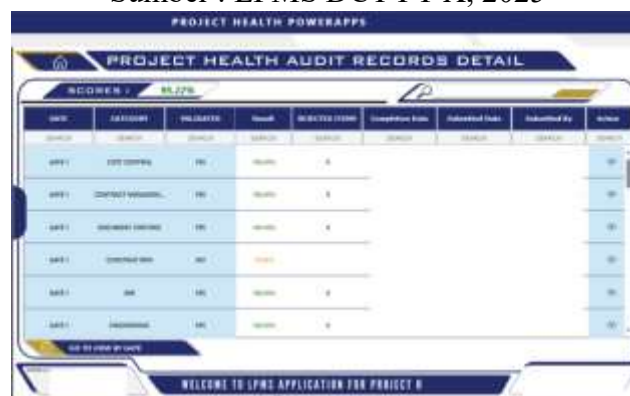
Gambar 4. Dashboard Project Health Check

Berbagai fitur yang disediakan oleh LPMS-DCT tidak hanya berfungsi sebagai alat visualisasi data proyek, tetapi juga memberikan dampak nyata terhadap proses pengelolaan proyek secara keseluruhan. Sistem ini tidak sekadar menampilkan informasi, melainkan menyajikannya dalam bentuk yang dapat langsung digunakan oleh berbagai pemangku kepentingan untuk mendukung proses operasional dan strategis. Beberapa aspek penting yang terdampak dengan adanya dashboard ini adalah :