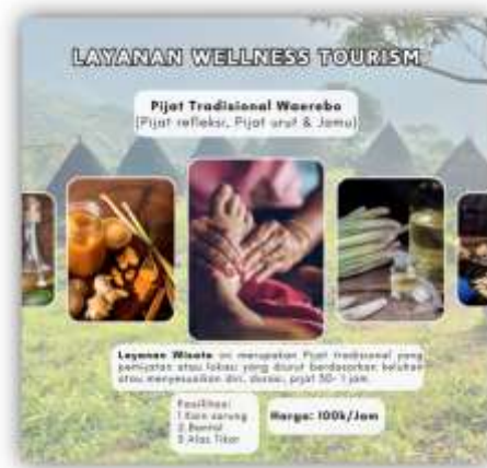
Gambar 4. Layanan Wellness Tourism Waerebo