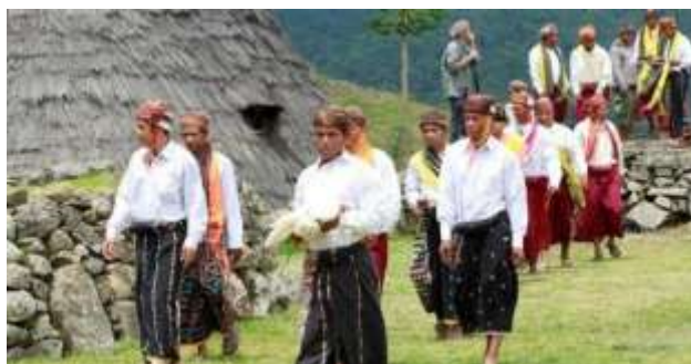
Gambar 2. Upacara Penyembuhan adat Waerebo

Tanaman yang digunakan oleh masyarakat Wae Rebo sebagai obat tradisional umumnya berasal dari sekitar rumah mereka dan dikembangkan di area perkebunan milik warga. Penggunaan tumbuhan obat ini merupakan tradisi yang diwariskan secara turun-temurun, mulai dari nenek moyang hingga generasi saat ini. Begitu pula dengan pemanfaatan bagian-bagian tanaman dalam pembuatan ramuan obat, yang sering kali didasarkan pada pengetahuan dan pengalaman yang diterima dari orang tua atau leluhur mereka.