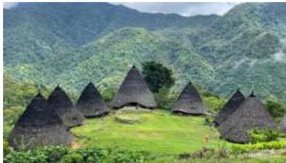
Gambar 1. Potret Keindahan Alam dan Budaya Waerebo

Secara geografis, desa ini memiliki topografi berbukit dengan kemiringan yang curam, ditumbuhi vegetasi yang lebat dan beraneka ragam flora dan fauna khas. Hutan di sekitar Waerebo menjadi habitat bagi 42 jenis pohon serta 38 spesies burung yang tercatat dalam survei Indecon pada tahun 2013, menjadikan wilayah ini kaya akan keanekaragaman hayati. Waerebo menawarkan berbagai jenis pengalaman wisata, mulai dari wisata trekking melintasi alam pegunungan, wisata alam untuk menikmati flora dan fauna endemik, hingga wisata budaya yang menonjolkan arsitektur rumah tradisional Mbaru Niang yang khas. Selain itu, pengunjung juga dapat menyaksikan upacara adat seperti penti dan tarian tradisional caci , meskipun keduanya tidak dilaksanakan setiap hari karena merupakan bagian dari ritual tahunan sebagai bentuk rasa syukur atas hasil panen. Tidak hanya menikmati pertunjukan budaya, wisatawan juga berkesempatan untuk tinggal di Mbaru Niang bersama warga lokal selama satu hingga dua hari, merasakan langsung kehidupan masyarakat dan belajar tentang adat istiadat yang masih dijaga secara turun-temurun.